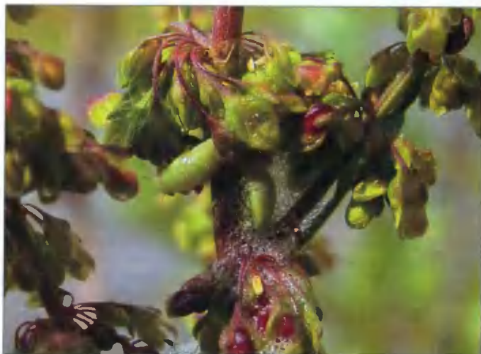
Личинка пенницы в своём «домике»

Все знают басню Крылова «Стрекоза и муравей»; её сюжет и героев отечественный классик позаимствовал у Лафонтена. В те годы, когда писалось данное произведение, цикады – обитатели тёплых районов планеты – практически не были известны в России. Переводя с французского «цигале» (sigale), Иван Андреевич выбрал в качестве его русского аналога слово... «стрекоза». Но ведь это насекомое не умеет ни петь, ни прыгать, как цикады! Получилась нелепица, однако нравочительная миниатюра Крылова не потеряла от такого казуса своего обаяния.