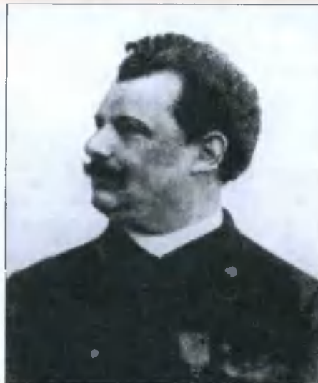
Воздухоплаватель Эдуард Спельтерини