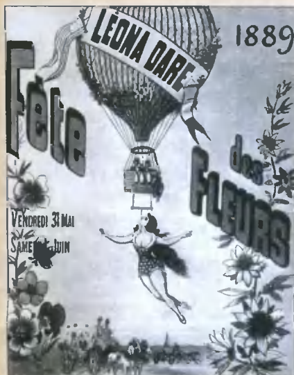
Афиша, извещавшая о полётах Леоны Дар в Париже