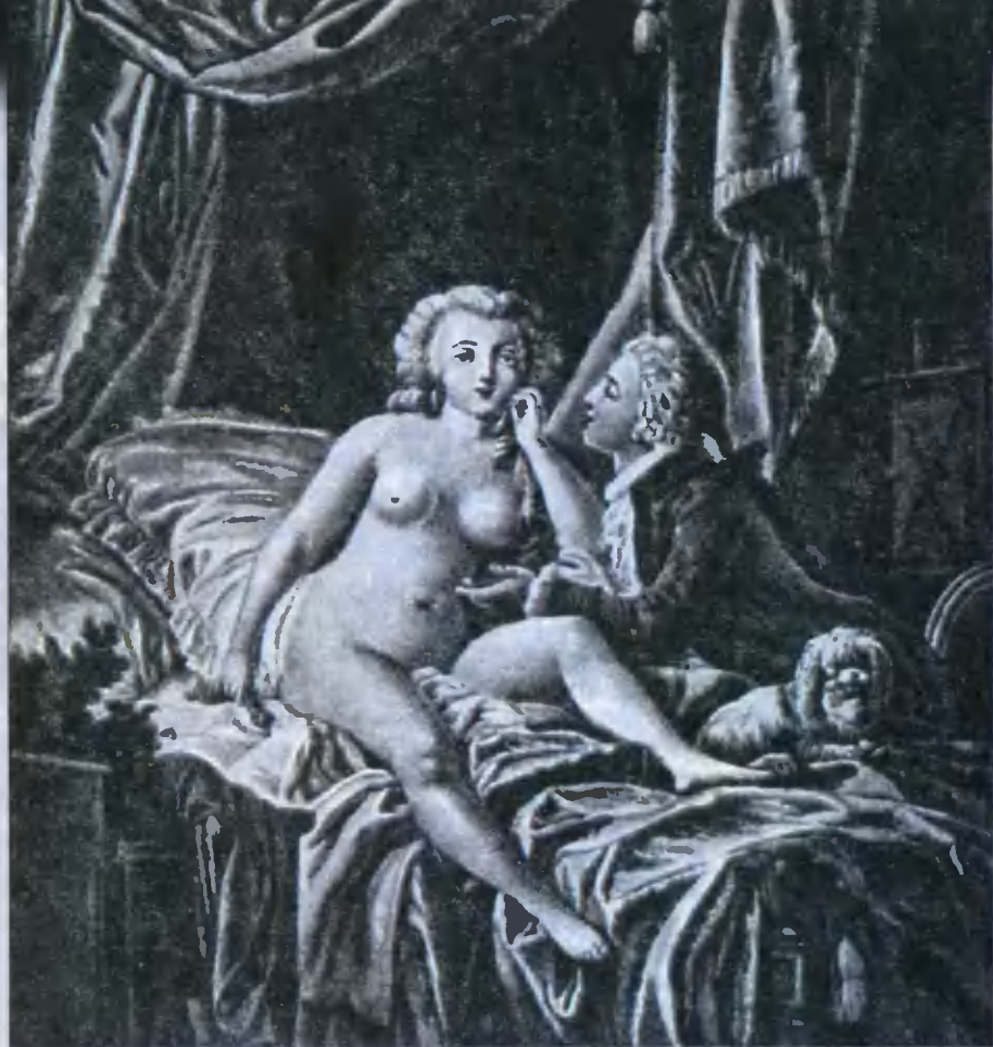
Галантная гравюра. Художник Юэ

«Так как любовь перестала быть страстью, дорожающей конечной целью, осу-