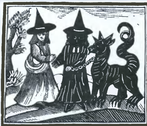
Старая гравюра, на которой изображены ведьмы

В истории известны неподобающие оргии ведунгов и ведьм, повторявшие древние языческие обряды с применением наркотических средств. Мази и напитки, применяемые ими, производили особый вид сомнамбулизма, который мог предполагать видение на