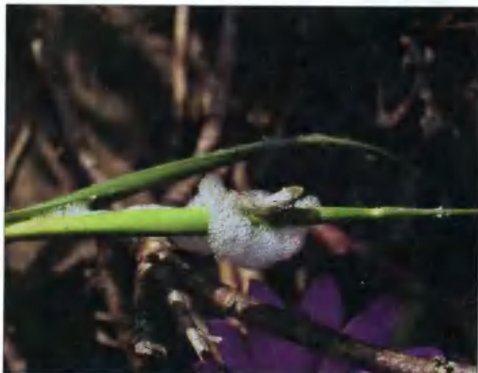
Ещё один «воздушный замок» скоро будет сдан в эксплуатацию