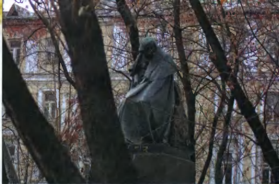
Памятник Гоголю. Скульптор Н.А. Андреев

После смерти Гоголя в его архиве нашли лоскуток бумаги со словами, напи-